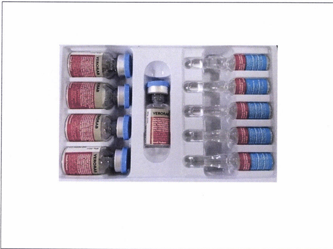
Larawan 2. Napatunayang pekeng vials at ampoules ng Verorab Rabies vaccine

Ayon sa pagsusuri ng FDA kasama ang Marketing Authorization Holder , Sanofi Pasteur Inc., ang nasabing produkto sa larawan 1 at 2 ay napatunayang peke.